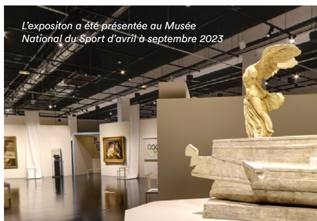
L'exposition a été présentée au Musée National du Sport d'avril à septembre 2023

Avec la collaboration exceptionnelle du musée du Louvre